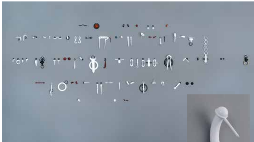
Botsøvelser, Gunhild Vatn